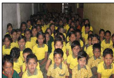
Kinderheim in Indien

Wir haben geholfen, ein Haus zu bauen mit Platz für 60 Kinder und ein anderes Kinderheim wird bald fertig sein.