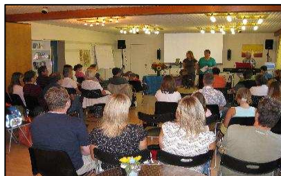
Ausbildungstag in der Schweiz